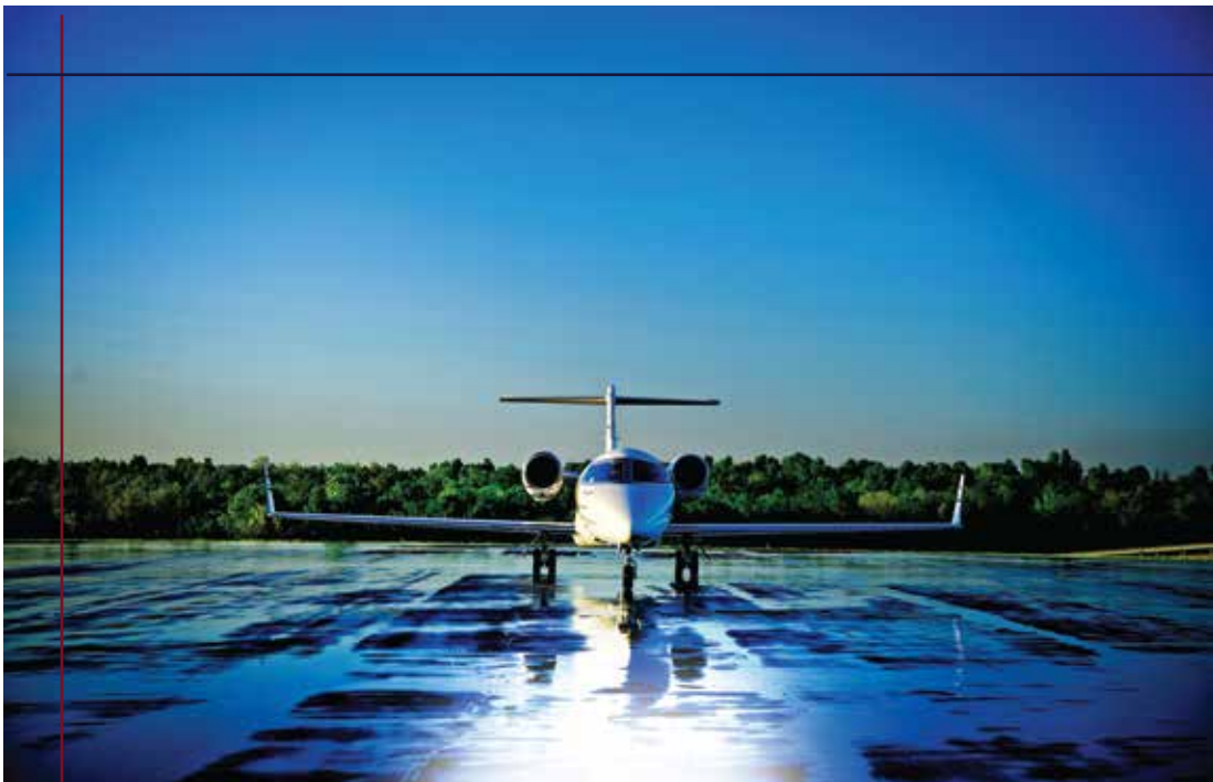
SUBTLE IMAGE/PAGE LINES